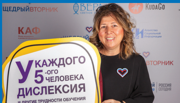
*Логотипы и шаблоны вы можете бесплатно скачать на сайте: щедрывторник.рф